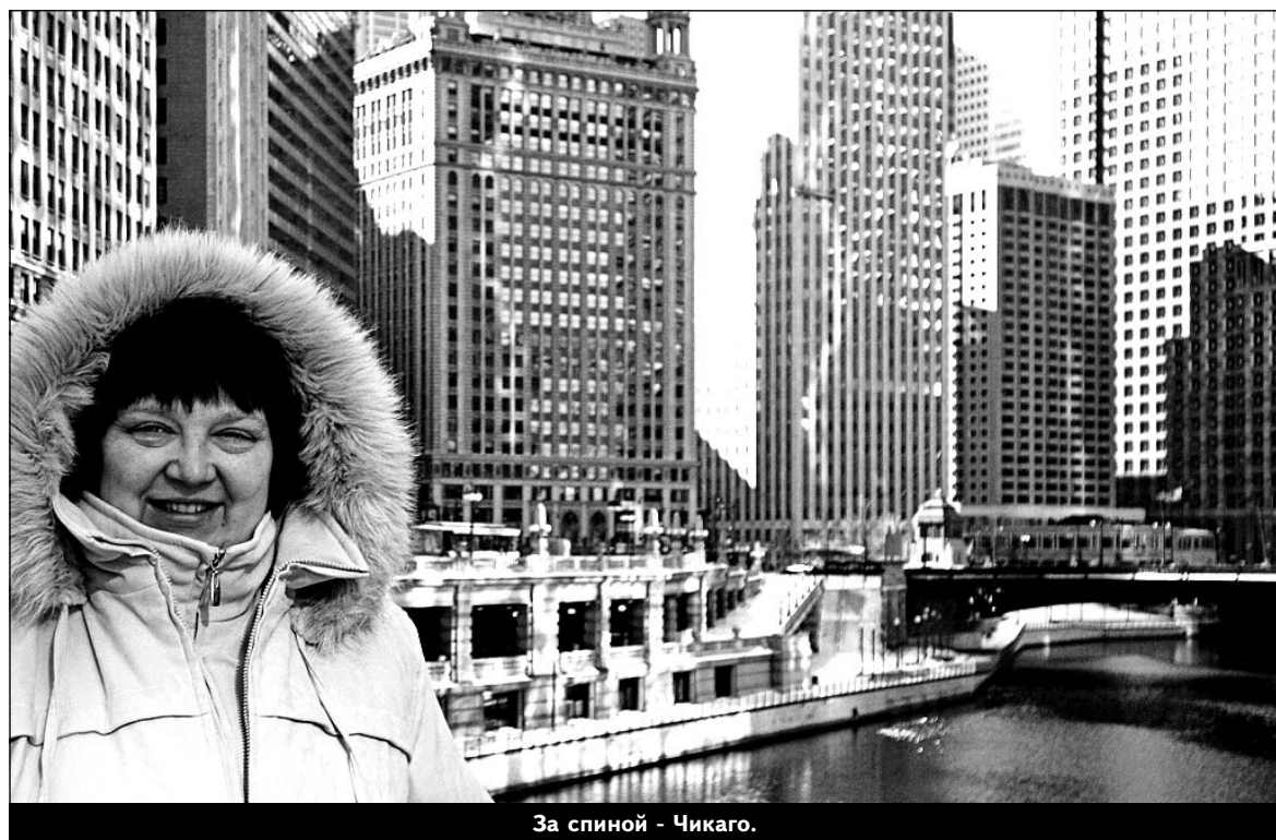
За спиной - Чикаго.

Кстати, из 11 млн. жите-лей Чикаго 800 тысяч - русскоговорящие, а поляков, говорят, там живет больше, чем в Варшаве.