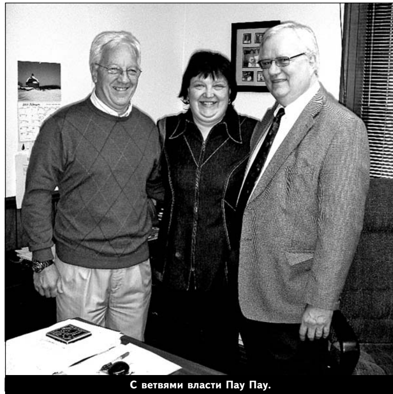
С ветвями власти Пау Пау.

Глобализация очевидна, удивить чем-то трудно. Там есть все, что у нас и наоборот, разнятся только цены, причем как в большую, так и в меньшую стороны.