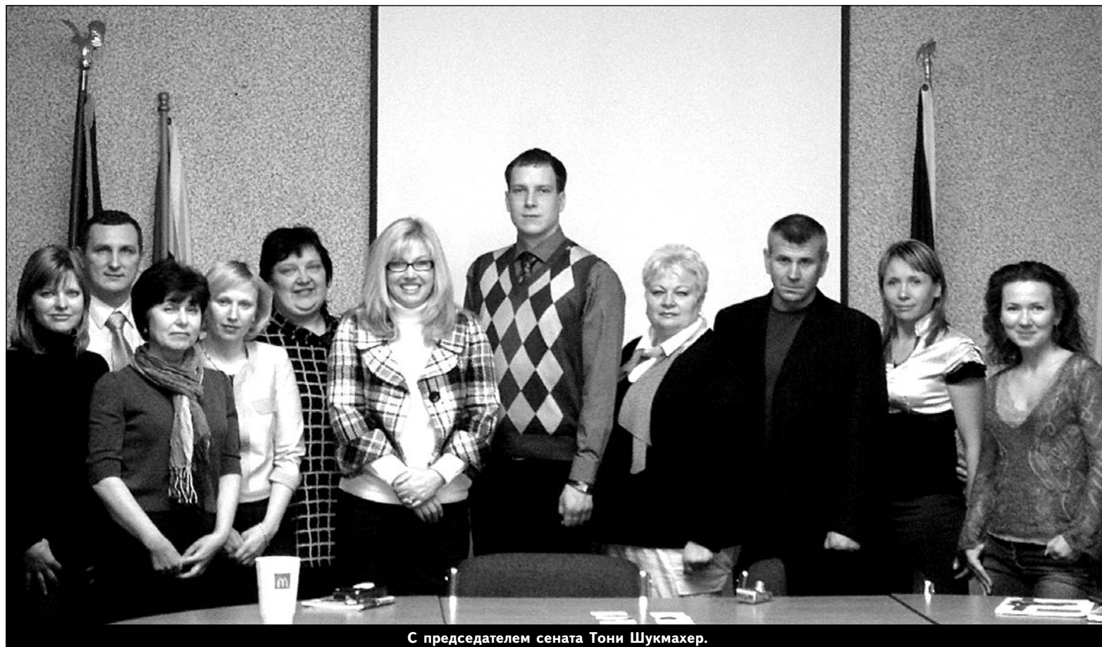
С председателем сената Тони Шукмахер.